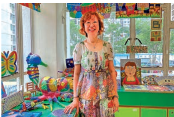
動提升學生的正能量

至於剛從幼稚園升讀小一的學生，李校長表示開始面授課堂後，將舉行紙筆評估，以供教師了解學生個別學習進度。李校長說，K3的小朋友幾乎半年沒上學，透過評估了解小朋友確切的學習進度，學校已另設「補底班」，供個別未能跟上學習進度的小朋友用。