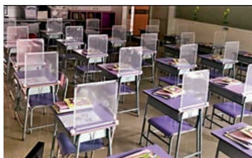
▲ 佛教林炳炎紀念學校已為每張學生桌安裝隔板，防止病毒透過飛沫傳播