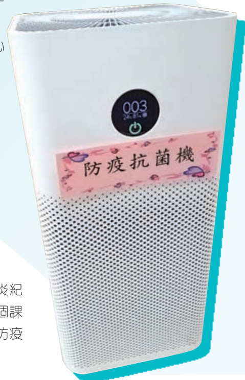
►佛教林炳炎紀念學校在每個課室內準備了防疫抗菌機