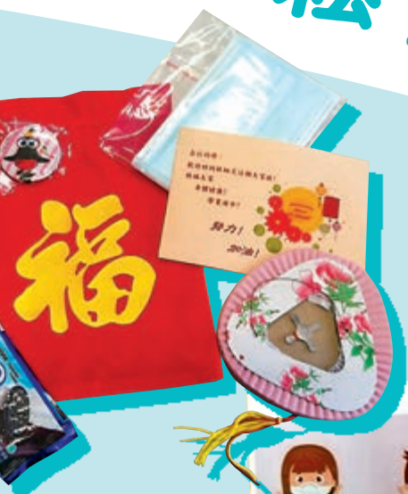
▲林炳炎學校派發「中秋福袋」，希望帶給同學們「一點甜」