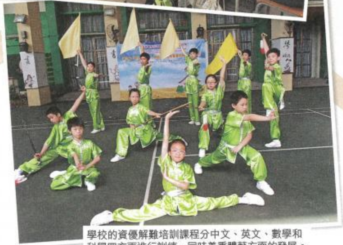
學校的資優解難培訓課程分中文、英文、數學和科學四方面進行訓練，同時着重體藝方面的發展。

學校於二〇一四年起在校推行資優培訓，由於在資優教育上早已有良好基礎，學生無論在學業成績、體藝和自信心方面都有明顯的進步，故學校希望嘗試將資優教育推廣至幼稚園，跟機構合辦共四堂的「幼稚園K2學生資優教育培訓課程」，並於六月舉行第十六屆國際資優解難大賽暨第一屆幼稚園葵青區賽。